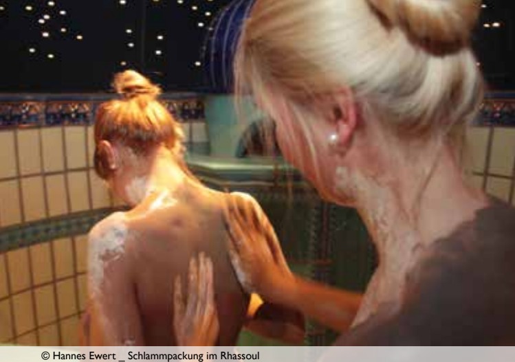
Schlammpackung im Rhassoul