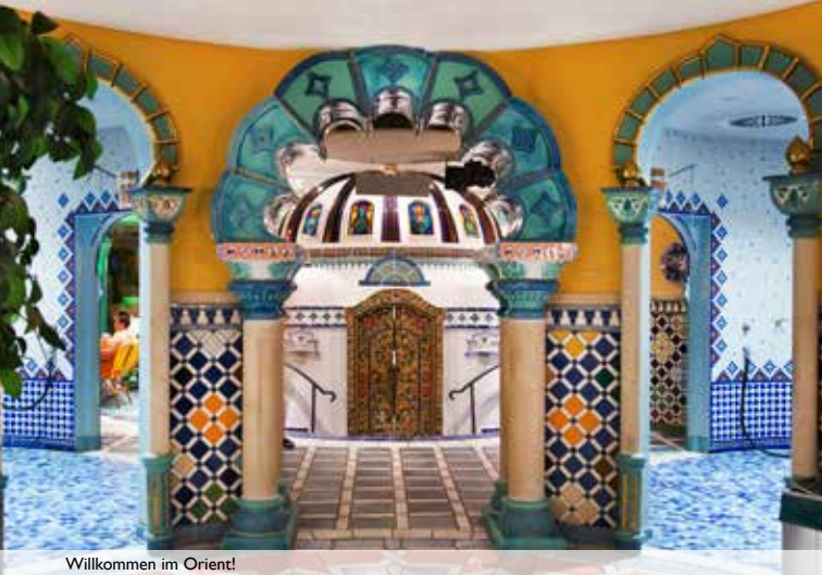
Willkommen im Orient!