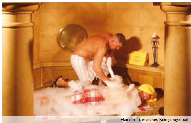
Hamam - türkisches Reinigungsritual