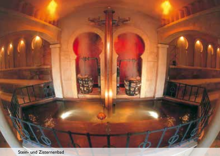
Stein- und Zisternenbad