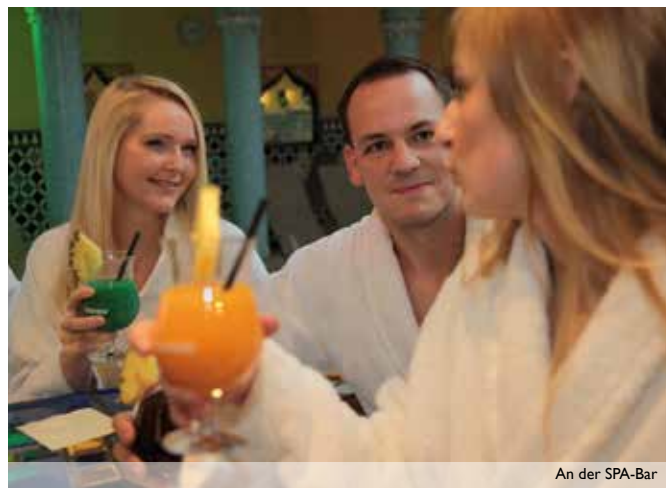
An der SPA-Bar

Für Druck und Satzfehler keine Haftung. (Gültig ab April 2019).