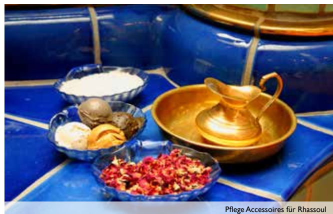
Pflege Accessoires für Rhassoul