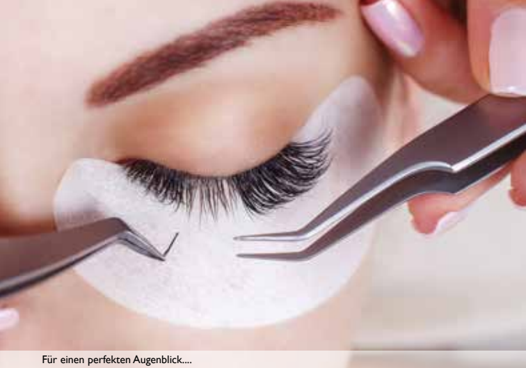
Für einen perfekten Augenblick...