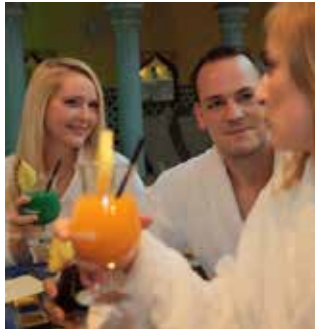
An der Saunabar Marrakech