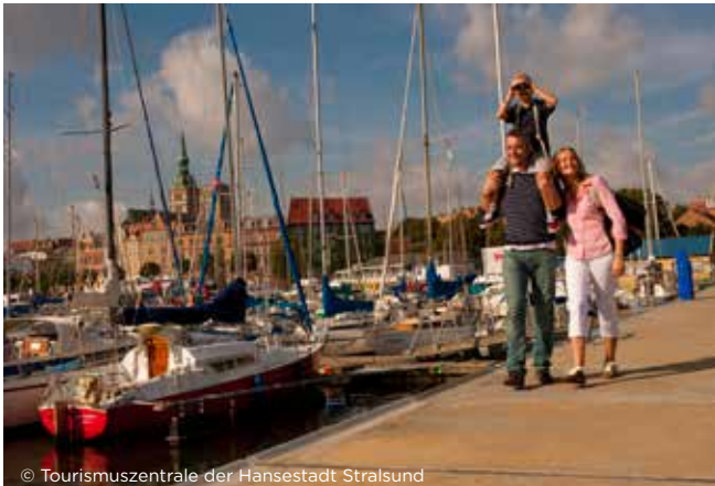
Am Hafen