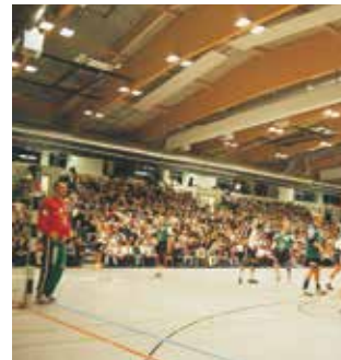
Handball in der VogelsangHalle

Messen und Kongresse finden hier den passenden Rahmen und entsprechende technische und räumliche Voraussetzungen.