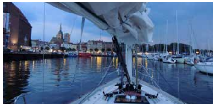
Leinen los - abends im Stralsunder Hafen