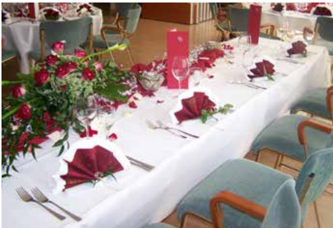
Familienfeierlichkeit im Bankettbereich