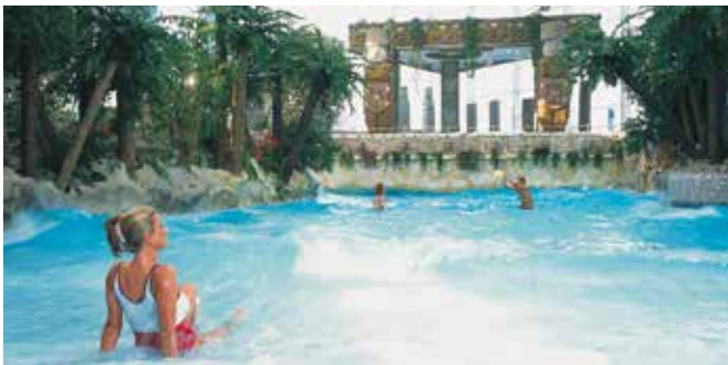
Wellenbecken im Erlebnisbad