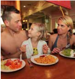
Badehosenrestaurant Käpt´n Nielson